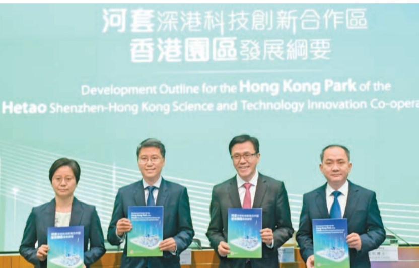
創新科技及工業局局長孫東（右二）等出席記者會，介紹《河套深港科技創新合作區香港園區發展綱要》。