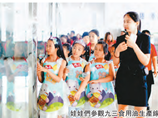
娃娃們參觀九三食用油生產線

2016年3月，國務院印發的《關於深化泛珠三角區域合作的指導意見》，首次提出打造粵港澳大灣區，建設世界級城市群。2017年7月1日，《深化粵港澳合作推進大灣區建設框架協議》在香港正式簽署。粵港澳大灣區建設納入國家《推動共建絲綢之路經濟帶和21世紀海上絲綢之路的願景與行動》。2018年4月舉行的博鰲亞洲論壇向外界再度釋放政策信號，粵港澳大灣區規劃即將出台。 四十年前，深圳特區轟轟烈烈的建設發展，加速了改革開放浪潮在全中國的迅猛鋪開；四十年後，擁有7000萬常住人口、GDP總量達到1.4萬億美元、最具發展空間和潛力的粵港澳大灣區經濟區，勢必成為中國乃至世界的新的經濟增長極。 戰略家嗅到了機遇的味道。九三集團作為北大荒農業航母的護衛艦，搶抓大灣區建設的歷史機遇，發揮企業在粵港澳區域的布局和資源優勢，爭做北大荒集團挺進大灣區的先遣軍和主力部隊。