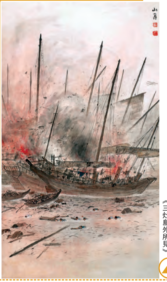
關山月畫作《三灶島外所見》

陳館長表示，數字美術館的建設是關山月美術館正在積極探索的方向。「我們會把產品文獻都放在資料庫裏，透過授權手機終端，讓大家可以查詢，這對於未來的學術發展有很大作用。」開幕當天，關山月美術館知識庫正式上線，知識庫囊括關山月的全部作品、圖片、視頻資料和近 200 多萬字的文獻，透過互聯網，市民即可共享關山月美術館的學術研究成果。同時，關館亦關注對文化、版權資源的開發與延伸。當日，「改革開放沿海城市美術家友好合作協議」也同時簽署。