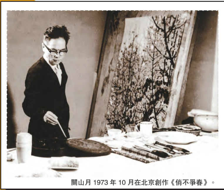
關山月 1973 年 10 月在北京創作《俏不爭春》。

深圳關山月美術館迎來 20 歲生日！在香港回歸祖國 20 周年之際，為紀念關山月美術館建館 20 周年，同時緬懷關山月先生，追憶其一生傳奇而輝煌的藝術歷程，6 月 27 日下午，「關山月和他的時代」關山月美術館建館 20 周年系列學術展正式拉開帷幕。當日，美術館高朋滿座，收到各方祝福。學術展呈現了關山月及與其同時期活躍的傳統大家的藝術畫作，帶來一場豐盛而充滿格調的文化大餐。展覽將持續至 7 月 21 日。