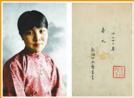
上世紀20年代的冰心和冰心手稿封面。

據悉，九州大學圖書館計劃與中國方面合作，讓更多的人看到《春水》手稿，促進中日學術文化交流。