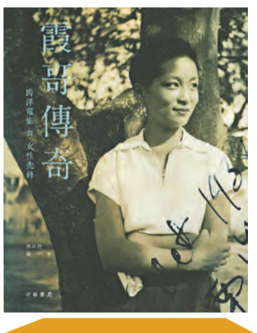
《霞哥傳奇：跨洋電影與女性先鋒》