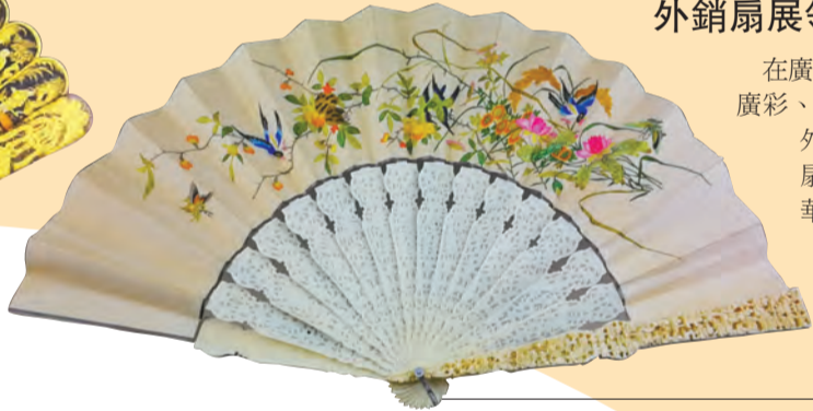
展覽現場展出精美外銷扇。