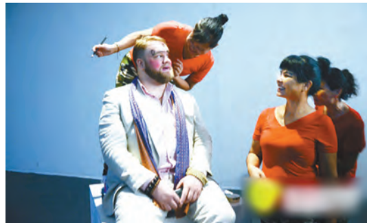
「聞香識羅湖」開幕現場，藝術家引入廣場舞大媽團體參與「香味」作品互動。