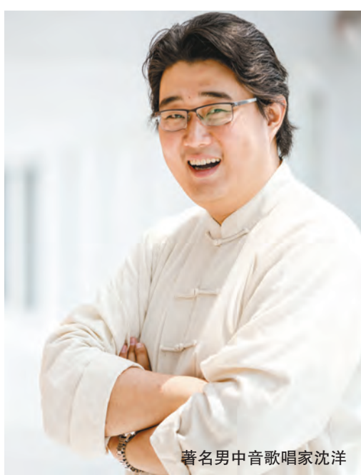
著名男中音歌唱家沈洋

中國藝術歌曲於20世紀20至40年代進入發展的興盛階段，作曲家創作出大量的膾炙人口的藝術佳作，如蕭友梅的《問》，青主的《大江東去》，黃自的《春思曲》、趙元任的《聽雨》等具有鮮明民族特色的藝術歌曲。這些作品一經問世，便表現出鮮明的藝術特色。本次沈洋獨唱音樂會囊括了多位中國音樂家的藝術歌曲，歌曲背後蘊含著豐富的故事和深遠的意境，每部作品背後都有一個令人回味的故事，無一飽含音樂家的愛國情懷和對故鄉的思念。本場音樂會特別邀請了青年鋼琴家，音樂創作人何嘉輝擔任鋼琴伴奏，以及新生代實力派青年女高音龔爽擔任特邀嘉賓，將重現蕭友梅、趙元任、賀綠汀、黃自等一批中國音樂家的風采，呈現中國音樂藝術的魅力，為觀眾演繹中國音樂史中輝煌的篇章。