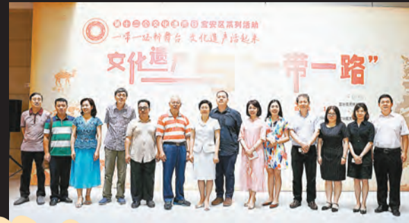
深圳寶安區「文化遺產日」活動「文化遺產與一帶一路」主題展覽開幕式嘉賓合影。

洋的異國情調，異域生輝、異趣盎然的中國外銷藝術品在西方掀起了「中國風」的社會時尚。