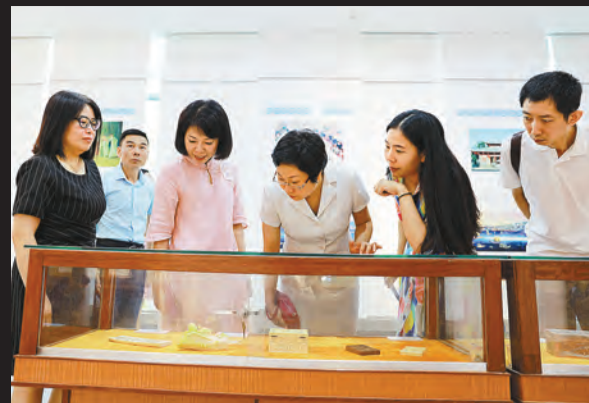
寶安區區長梁敏華（中）與眾嘉賓觀賞展品。