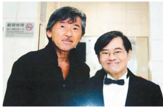
林子祥不少歌的歌詞都出自鄭國江之手。