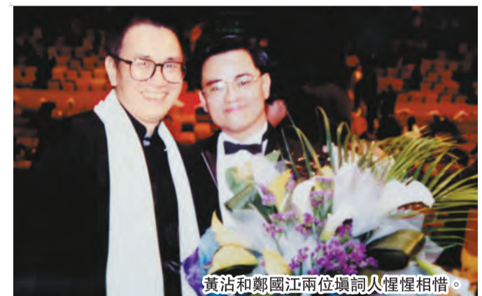
黃沾和鄭國江兩位填詞人惺惺相惜。