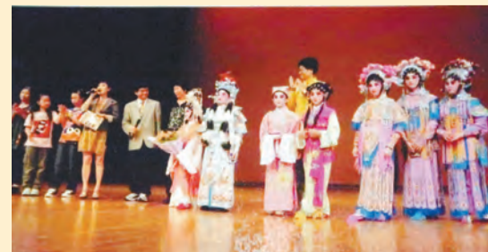
鄭國江編寫多出兒童粵劇。

《風閣恩仇未了緣》的劇情而寫出少年版的《胡地蠻歌》。2015 年創作《花木蘭》，2016 年創作《迷途羔羊》。他不單寫兒童劇，還有大人劇《代代扭紋柴》、《少年楊家將》等，又和編劇班同學六人一人一幕合寫《瓊花仙子》、《麒麟送子》、《寄恩仇》、《浴佛奇緣》等粵劇。