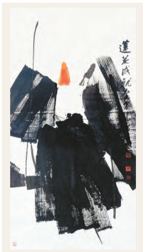
呂壽琨作品《蓮花成就》，1968年

強；以及採用傳統技巧演繹當代趣味的學院派新秀卓家慧、何冠廷、許開嬌與張小黎。他們的水墨融和了含蓄細膩的東方韻味及西方現代視覺張力，以戲謔批判或內省潛思的姿態呈現，構建了後97香港當代水墨的面貌。香港商報記者 金敏華