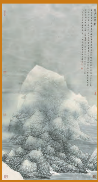
陳履生畫作《寒月白千峰》