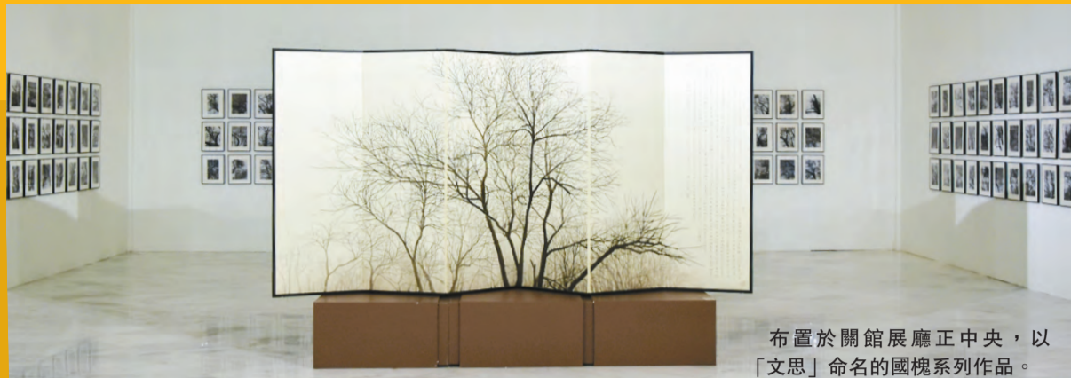
布置於關館展廳正中央，以「文思」命名的國槐系列作品。

6月7日，「務本——陳履生畫展」在關山月美術館隆重開幕，同日開啟的陳履生「知行合一」書法展和「光影造化」攝影展亦分別在深川美術館與越眾歷史影像館拉開帷幕。一城三展，展示了藝術家陳履生蓬勃的創造力和藝術相互貫通的精神實質，讓大眾領略到一位多才多藝的藝術家所構建起的藝術大廈，同時也傳達出了藝術家對於傳統文化的繼承擔當和對傳播高雅文化的殷切期待。「路漫漫而修遠兮」，陳履生正是行走在孜孜探求路上的一位。香港商報記者 陳柳燕