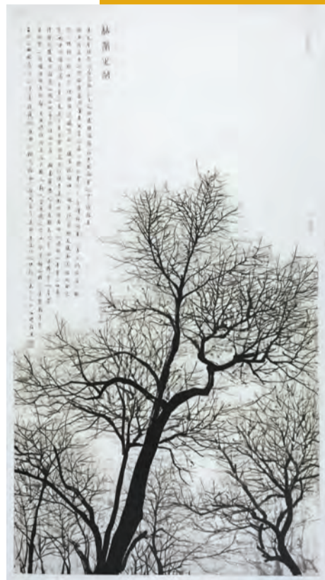
陳履生畫作《枯榮之間》

博物館建築的特殊性使得世界上很多博物館都成為城市裏獨特的地標，陳履生通過自己的視角和鏡頭語言，呈現了博物館建築美，也展現了它的文化品位與城市關係。此外，他亦將鏡