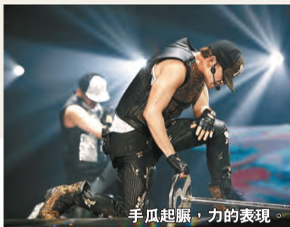
手瓜起脹，力的表現。