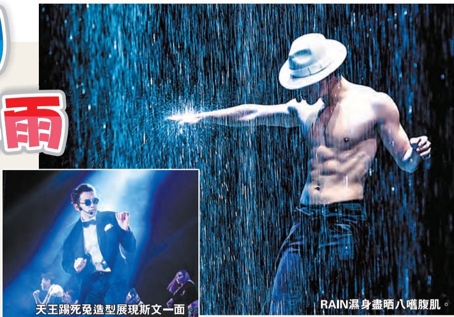
天王陽死兔造型展現斯文一面。

出道17載，RAIN今次王者歸來世界巡演，別具意義。為此，他特別與團隊編排了多個爆發力十足的舞步，配合其熱爆經典金曲，如：《I Do》、《Rainism》、《La Song》、《YOU》及热播大劇《克拉戀人》主題曲等，盡情發揮舞台王者本色。最值得一提的是，大會還用上7位數字打造巨型的「Water Fall」，50米超寬舞台，史無前例的12米巨型水幕，如夢似幻的3D暴風雨震撼效果，可以讓天王赤裸上身晒八噏腹肌之餘，還可來回穿梭於巨型水幕間，大玩濕身誘惑，勢必掀起韓迷狂呼熱叫。