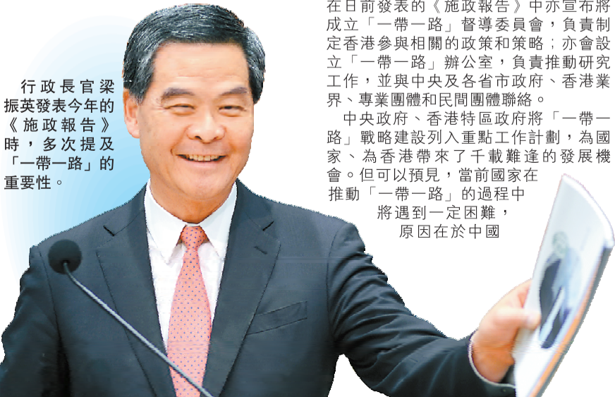
行政長官梁振英發表今年的《施政報告》時，多次提及「一帶一路」的重要性。

大會廣邀香港各界人士出席論壇，進一步了解「一帶一路」的實質意義，從而更好地把握發展機遇，實現事業新突破，共同為國家和香港保持長期繁榮穩定貢獻力量。