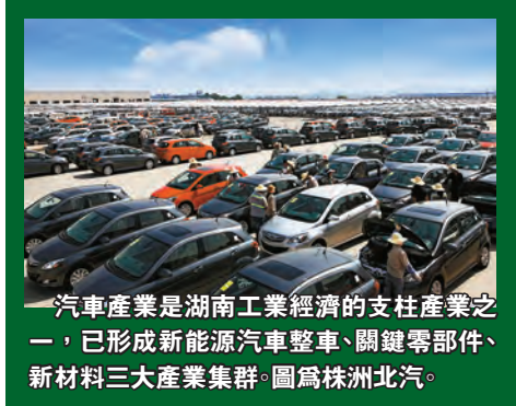
汽車產業是湖南工業經濟的支柱產業之一，已形成新能源汽車整車、關鍵零部件、新材料三大產業集群。圖為株洲北汽。