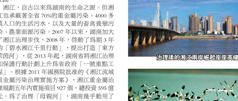
治理後的湘江兩岸崛起座座高樓。

洞庭湖是湖南的母親湖。但多年來，污染成爲洞庭湖之痛。2006年底，湖南採取行動，岳陽、益陽和常德三市234家造紙企業全部停產整治。最終成功將洞庭湖水質由原來的劣五類轉爲三類，失蹤多年的江豚又現江湖。 湘江，自古以來爲湖南的生命之源。但湘江也承載著全省70%的重金屬污染、4000多萬人口的生活污水，以及大量的畜禽養殖污染、農業面源污染。2007年以來，湖南加大了湘江治理步伐，2008年，啓動了爲期3年的「碧水湘江千里行動」，提出打造「東方萊茵河」，從2013年起，湖南省將湘江治理和保護行動計劃上升爲省政府「一號重點工程」。根據2011年國務院批准的《湘江流域重金屬污染治理實施方案》，湘江重金屬治理規劃五年內實施項目927個，總投資595億元。爲了治理「母親河」，湖南幾乎動用了