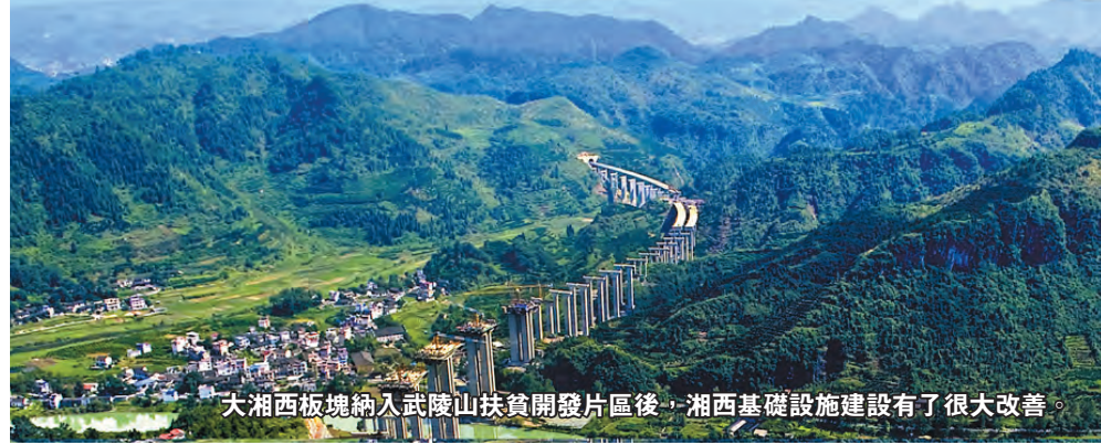
大湘西板塊納入武陵山扶貧開發片區後，湘西基礎設施建設有了很大改善。