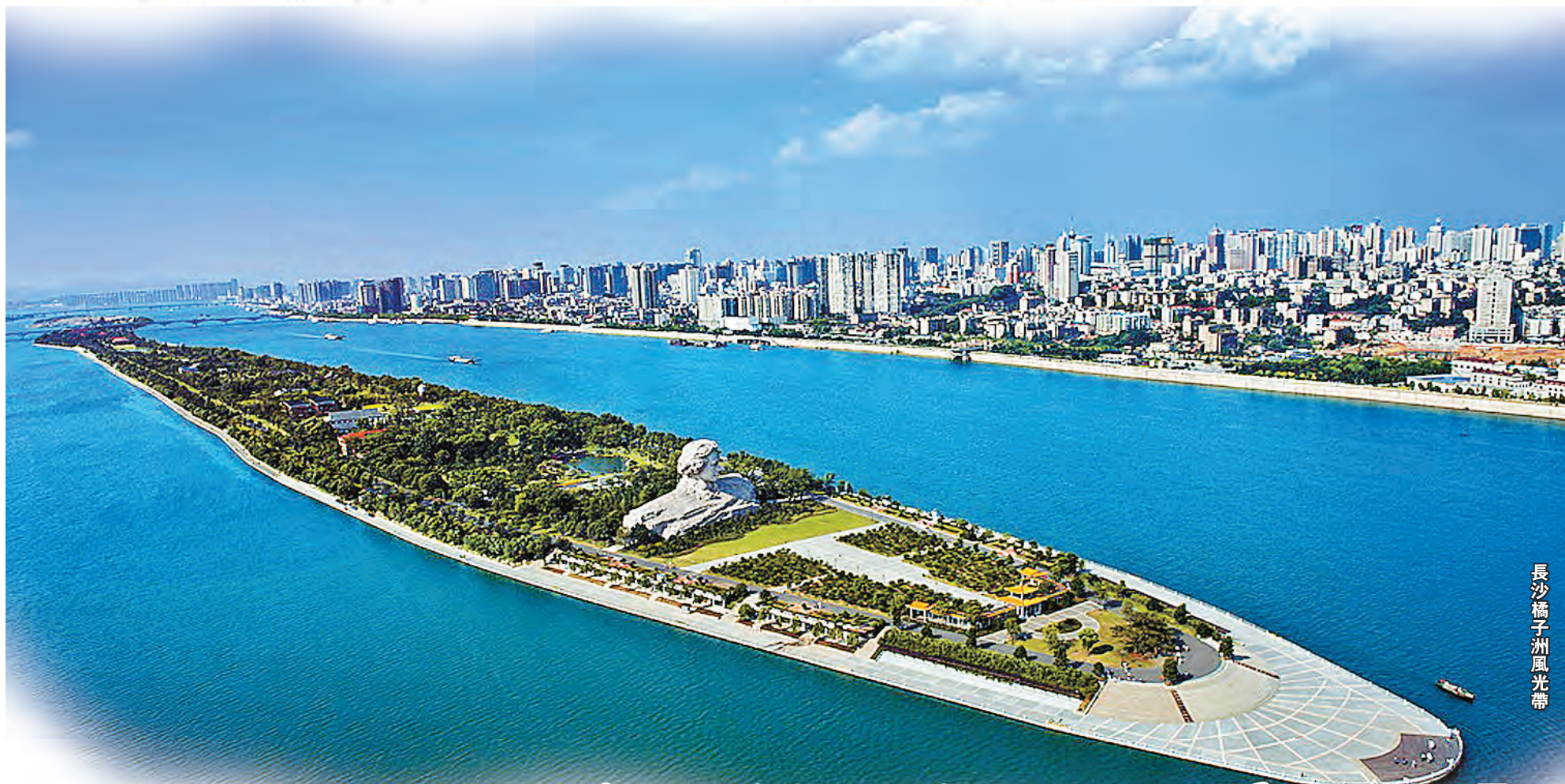
長沙橘子洲風光帶