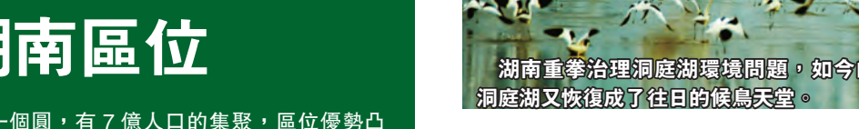
湖南重拳治理洞庭湖環境問題，如今的洞庭湖又恢復成了往日的候鳥天堂。