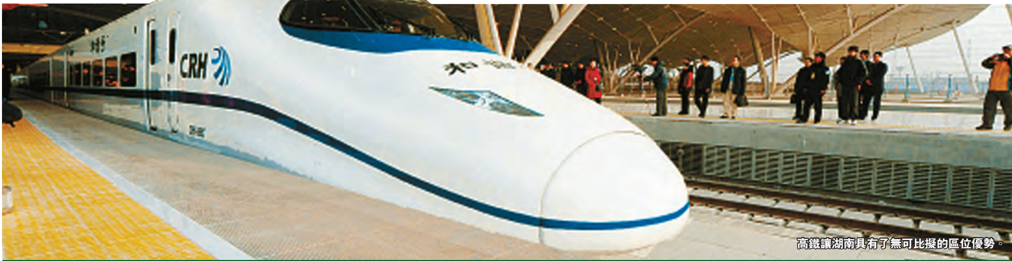
高鐵讓湖南具有了無可比擬的區位優勢。

「湖廣熟，天下足」，湖南以「魚米之鄉」聞名世界。農業的發達，本應成為湖南經濟發展最堅實的基礎，但是在經濟發展高度依賴現代工業文明的今天，這似乎成了湖南裹足不前的原因。一度以來，湖南的經濟結構有三「偏」嚴重。 2005年12月，在「中部崛起」的大背景下，原交通部部長張春賢調任湖南省委書記。主政湖南的張春賢為湖南最終定下了以「新型工業化」為主的治湘策略。 翻開湖南十年來的發展大計，「新型工業化」始終是最重要發展戰略，並被延續至今，是名副其實的「富民強省」第一推動力。自2006年省第九次黨代會明確提出實施新型工業化帶動戰略以來，湖南省委、省政府先後出台《關於加速推進新型工業化進程的若干意見》等40多個政策文件，成立高規格的加速推進新型工業化工作領導小組，啓動實施「雙百工程」、「四千工程」、「多點支撐」等一系列戰略部署。 為繼續發揮新型工業化第一推動力作用，強化工業經濟對全省經濟的重大支撐作用，2014年7月，湖南發布《關於進一步加快推進新型工業化的決定》，在市場培育方面、企業培育方面、創新發展方面著力深化改革。 十年的工業累積，讓湖南的工業亮點十足，移動互聯網、汽車等產業發展引人矚目。長沙高新區作為省移動互聯網聚集區，累計融資已超300億元，全省從事移動支付業務的企業數量和交易額均領先中西部地區。湖南省首款量產純電動汽車眾泰雲100成功上市，大眾汽車即將投產，年產能將達30萬輛整車，同時湖南省第一款高端SUV車型廣汽菲亞特吉普項目，預計將於2015年投產，汽車產業發展將掀新高潮。