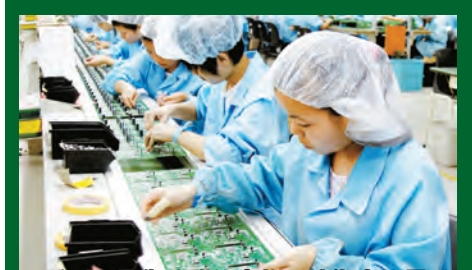
新型工業化戰略的實施，讓湖南的電子信息等新興工業得到飛速發展。