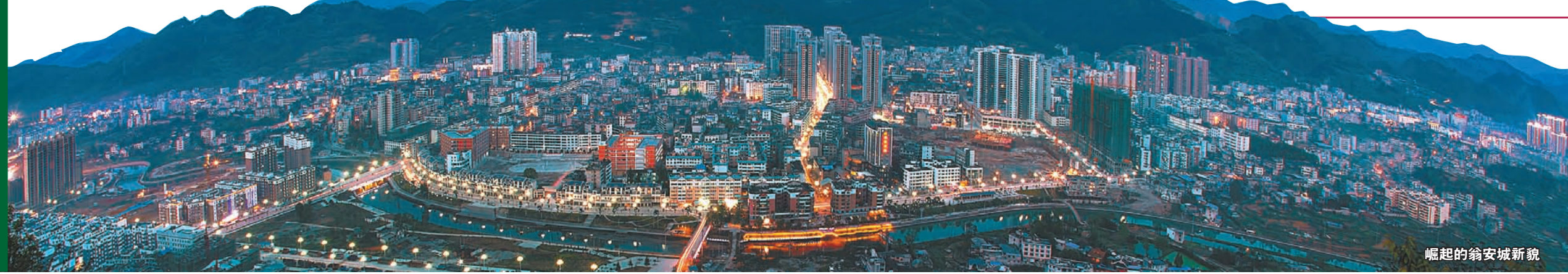
崛起的翁安城新貌