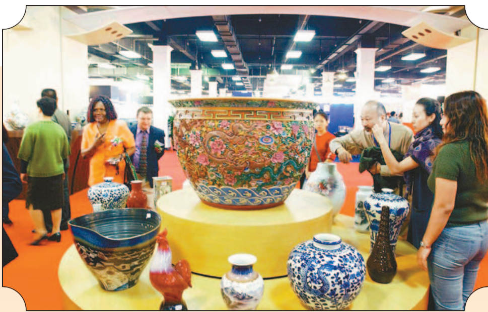
精美瑰麗的景德鎮陶瓷，無論在哪裏都是眾人矚目的焦點。