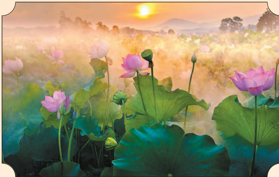
姚西賞蓮天上有，人間難找第二村。圖為「賞蓮第一村」廣昌姚西村。