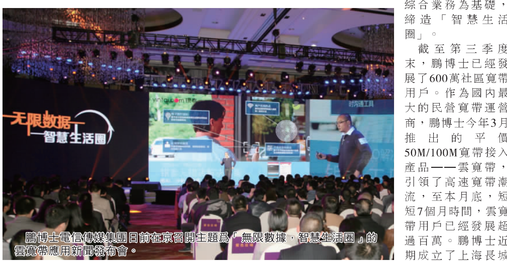
鵬博士電信傳媒集團日前在京召開主題為「無限數據，智慧生活圈」的雲寬帶應用新聞發布會。