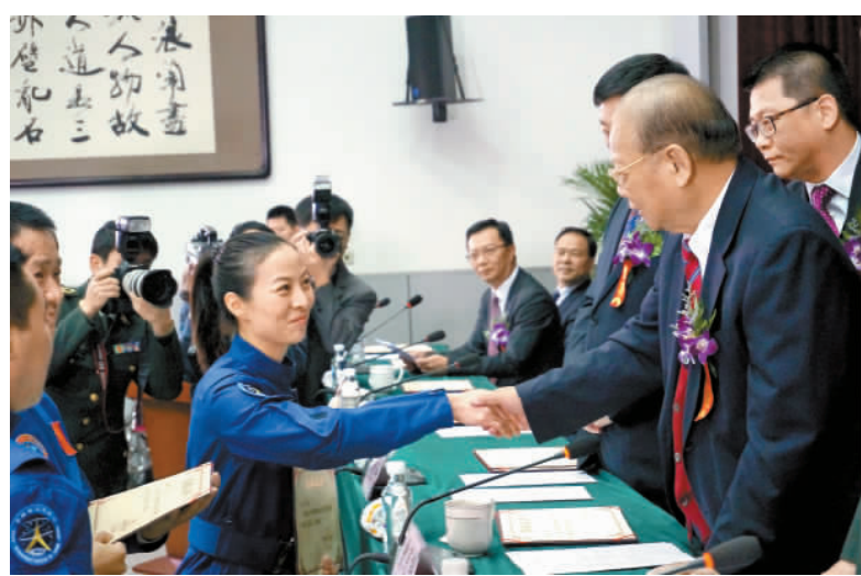
曾憲梓頒特別貢獻獎予王亞平。

【香港商報訊】記者放雷北京報道：曾憲梓載人航天基金會2013年度頒獎大會2日在北京航天城舉行，重獎神十航天员，聶海勝、張曉光、王亞平分別獲得80萬元人民幣（約合101萬港元）特別貢獻獎，53名載人航天工程科技技術骨幹和航天员獲得突出貢獻獎。