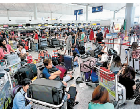
大批旅客無奈地滯留機場。