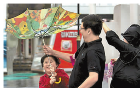
大風吹翻雨傘，小朋友及大人都感無奈。