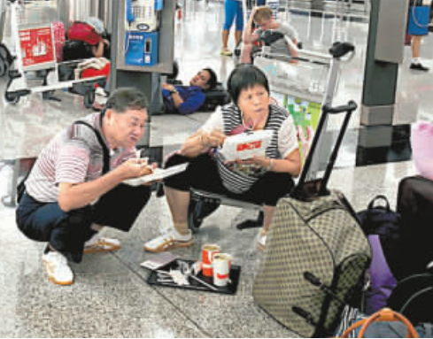
一對內地旅客在機場吃午餐飯盒，等待候補機位。

此外，本港渡輪航線在風暴下於晚上7時至8時停航，來往澳門及內地的渡輪服務亦停航。珠江客運公布，取消昨晚6時前開往珠三角所有船班，亦取消今日下午3時前由珠三角開返香港的所有船班。陸上交通方面，隨著8號風球高懸，電車於晚上8時停駛；新巴與城巴、九巴與龍運巴士所有路線於晚上8時40分停駛，山頂纜車在晚上7時半停駛；地鐵則仍然維持有限度服務。此外，在強風下，當局收到12宗樹塌報告，無人受傷。