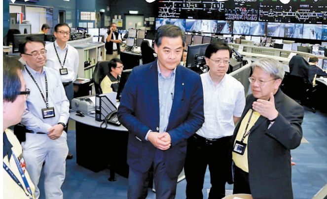
梁振英(右三)在港鐵的車務控制中心，了解中心如何在颱風期間監察及協調列車服務。