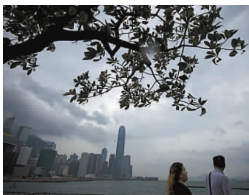
市民在碼頭體驗「風雲變色」。