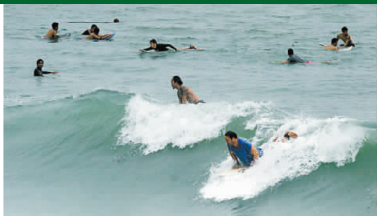
三號風球下，有市民在港島衝浪樂園大瀾灣玩命衝浪。