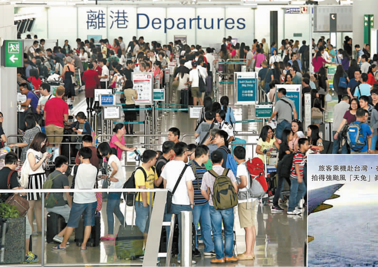
大批旅客湧到機場趕在傍晚6時所有航機停飛前，爭取候補機位離港，櫃位人龍處處。