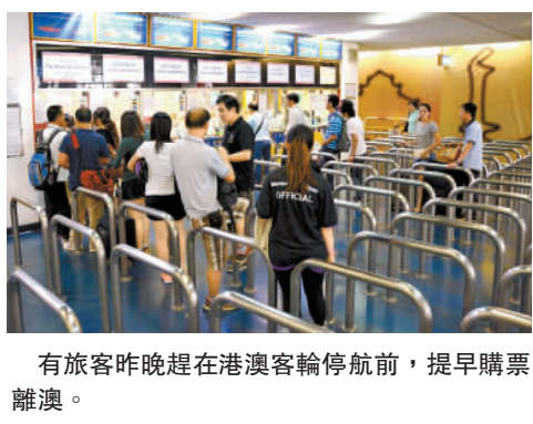
有旅客昨晚趕在港澳客輪停航前，提早購票離澳。

在打鼓嶺風風湖村，有村民一早已趕着收割瓜果等農作物，亦做好準備，包括清理家居附近排水道的樹葉，確保雨水順利排走，又將屋外位於高處的雜物放在地面或屋內，以防被強風吹倒。記者 周偉立