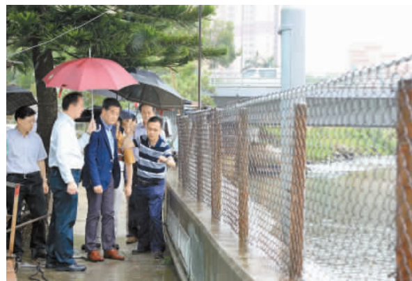
梁振英視察屯門嘉和里的水浸黑點，了解渠務署各項防洪措施。