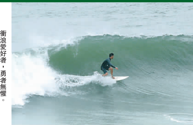
衝浪愛好者，勇者無懼。