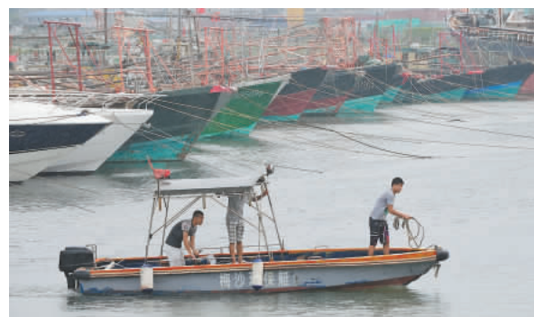
深圳防禦「天兔」，大小漁船回港避險。廣東省漁政總隊深圳支隊隊員加大對南澳轄區海上巡查，保障漁民安全。

記者從深圳機場邊檢站獲悉，受強颱風「天兔」影響，昨日蛇口、深圳機場口岸(包括福永碼頭)碼頭來往港澳的出入境船班全部停航，超過60個班次航班被取消。深圳機場方面，下午至夜間的国际入境航班也受到較大的影響，共計10餘個入境航班取消；往來澳門的12個班次直升機也取消。鐵路交通方面，「天兔」帶來的狂風驟雨對京九、廣深、京深高鐵路、廣珠城際、三茂等幹線鐵路運輸造成影響，部分列車晚點、停運。鐵路部門將視風風影響情況，再行調整