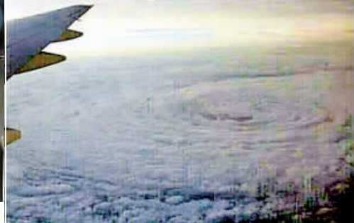
旅客乘機赴台灣，在3萬呎高空的航機上拍得強颱風「天兔」真貌。(網上圖片)