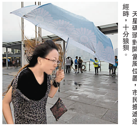
天星碼頭對開當風位置，市民搶遮避雨，十分狼狽。