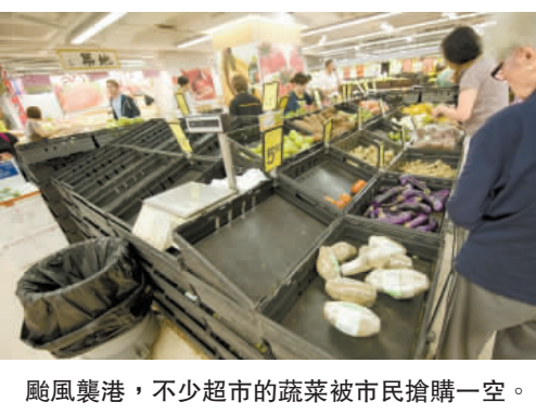
颱風襲港，不少超市的蔬菜被市民搶購一空。

港島南區大瀾灣「衝浪樂園」，3號風球下引來十多位衝浪愛好者前來「玩命」，但他們顯見是高手，風浪越大，勁頭越高。而每逢打風都引來「追風者」的尖沙咀碼頭，也有不少