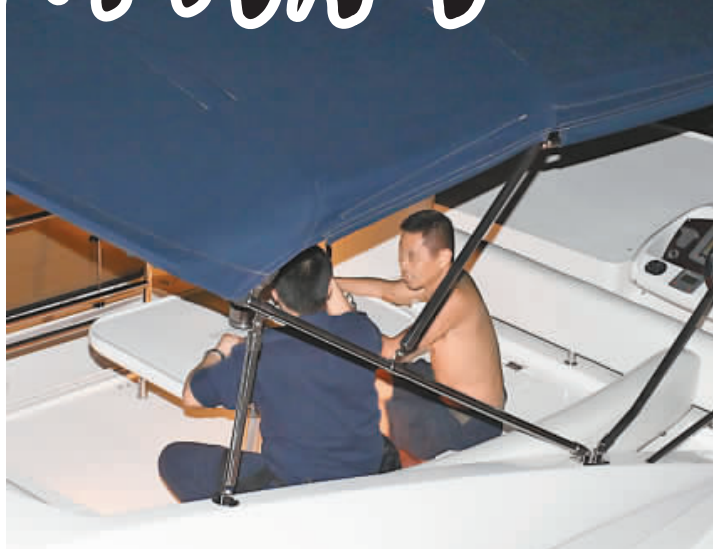
涉事船長(右)在現場接受調查。