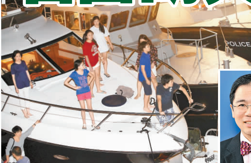
胡興正親友在遊艇上等候救援消息，惜最終傳來噩耗。