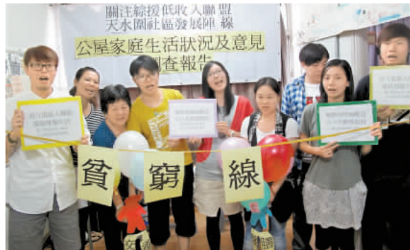
公屋家庭促訂策防跌入貧窮線。

【香港商報訊】本報記者何加祺報導：扶貧委員會將於本月28日公布香港首訂定的貧窮線。針對當局將公屋租金津貼當作家庭入息計算，令部分貧窮家庭「被脫貧」，關注綜援低收入聯盟及天水圍社區發展陣線昨日公布「公屋家庭生活狀況調查」，發現九成受訪家庭正處於入息中位數七或以下，大部分人更表示靠現時的收入無能力儲蓄，即使有公屋亦難以脫貧。有關團體提出系列建議，包括「住戶開支」量度貧窮情況及訂定扶貧措施，及盡快制訂及推行低收入家庭補貼方案，支援在職貧窮家庭。