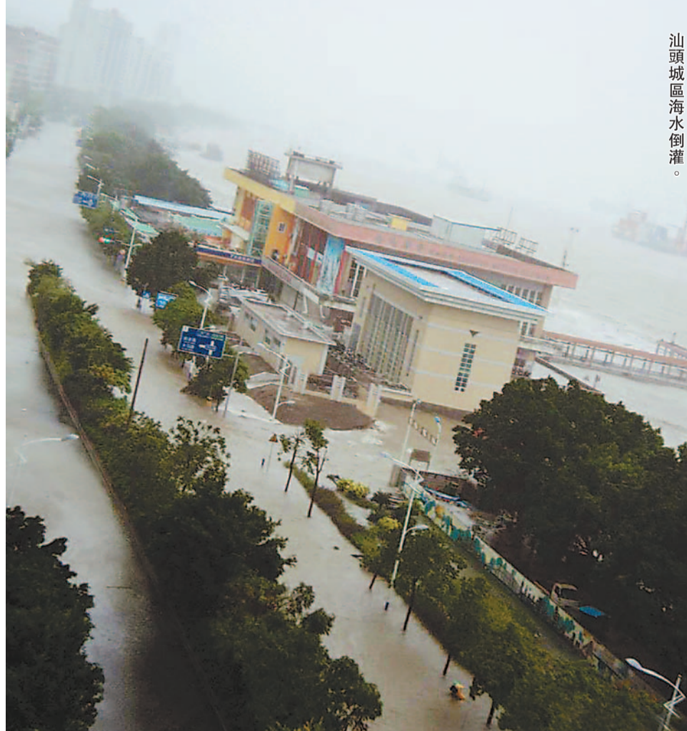
汕頭城區海水倒灌。

深圳宣布，22日至23日，中小學、幼兒園、託兒所停課，建築工地停止高空、露天作業，濱海遊樂場所、旅遊景點停止營業。