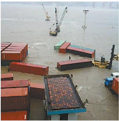
深圳港集裝箱被掀入海中。

當日，大亞灣核電基地6台機組保持安全穩定運行，其中嶺澳核電一期、嶺澳核電二期共4台機組已按廣東電網要求減載運行。陽江、台山核電基地已停止戶外施工作业，現場人員、廠房、設備設施安全，無異常情況。