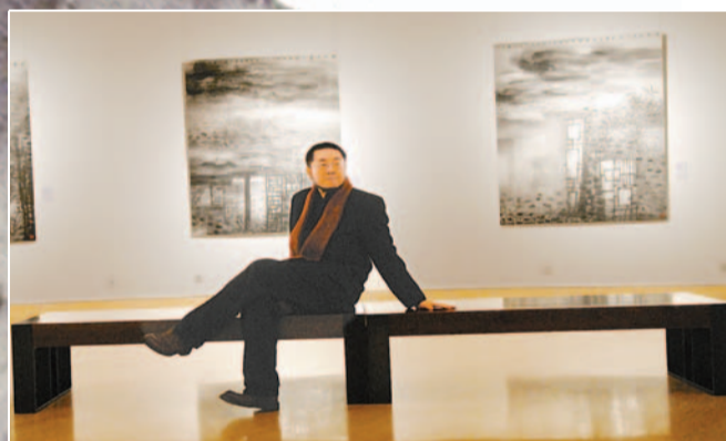
中央美術學院美術館館長王璜生