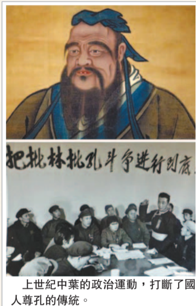
上世紀中葉的政治運動，打斷了國人尊孔的傳統。