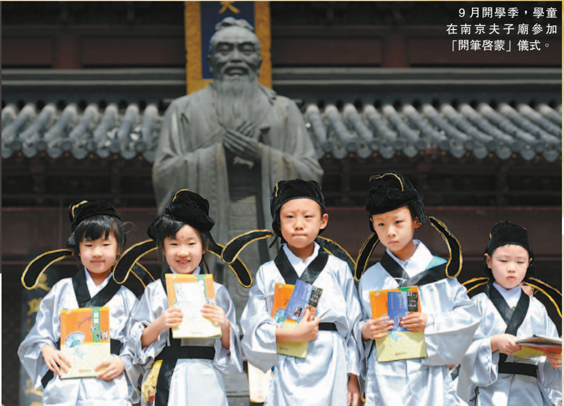
9月開學季，學童在南京夫子廟參加「開筆啓蒙」儀式。

學者們指出，孔子最偉大的地方並不是教育，而是在中華文明傳承到了最危急時刻，到了要「滅斯文」的歷史關頭，以一己之力，憑著強烈的歷史責任感和擔當，蒐集整理了華夏文明的典籍，將傳承了幾千年的世界上最早的至上神宗教——「中國教」的教義，第一次系統化、書面化，形成了偉大的「六經」。諸子百家著作及秦漢政治人物的尊孔的理由皆是推崇其編撰六經的歷史功績，使華夏文明的薪火傳承萬代。當然，孔子不但編撰經典，還周遊列國宣傳六經思想，引導天下萬國回到溥天之下莫非王土率土之濱莫非王臣，禮樂征伐自天子出，共同維繫太平的天下秩序，共同追求世界的大同。儘管沒有成功，但後世的人們繼承了他的衣鉢，才有了幾千年的文明傳承。而為了實現這個追求，孔子開學廣收學生，教育是他的手段，而他第一不是中國歷史上最早辦學的，也不是那個時代惟一辦學的，孔子之所以成為聖人，也不簡單的是因為其會教學，更主要的是孔子的追求，孔子的精神，孔子的歷史貢獻。