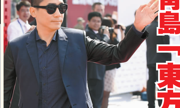
周董專程到青島參與盛會。