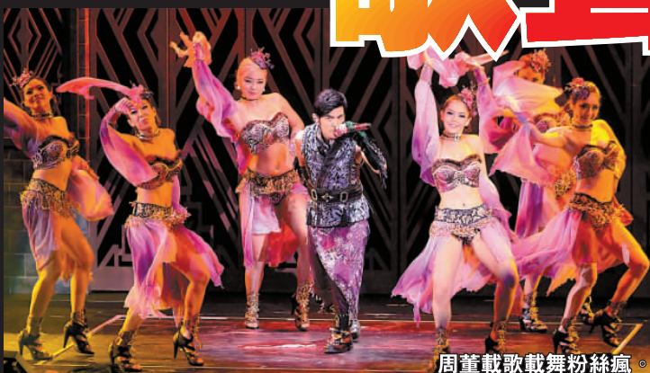
周董載歌載舞粉絲瘋

常捨不得香港，這幾天不但有逛喜歡的店舖，還帶朋友一起吃香港的美食，有颱風搞局也罷，可以多在香港呆一天。」因台灣也頗受颱風影響，有記者問周杰倫可有關心身在台灣的緋聞女友昆凌，他卻以微笑帶過，假裝不清楚對方的近況！