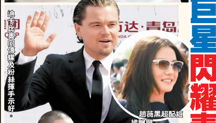
趙薇黑超配短裙贈興。