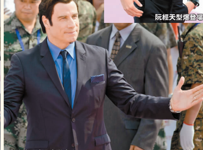
甄特華達也應邀出席。