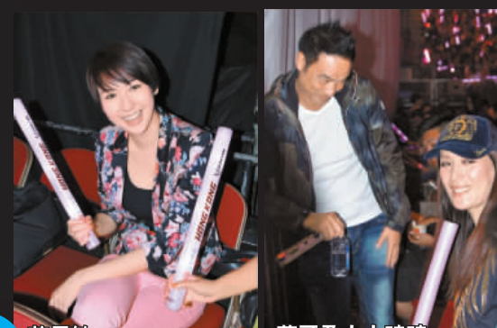
B哥跟周董相識十多年，惟合作機會5隻手指數晒。