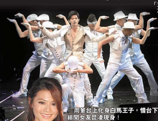
周董台上化身白馬王子，台下閩女現身！