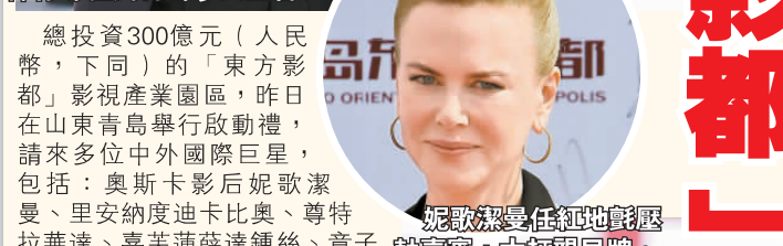
妮歌潔曼任紅地毯嘉賓，大打親民牌。