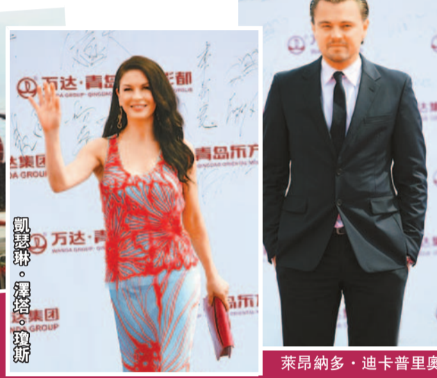
萊昂納多·迪卡普里奧