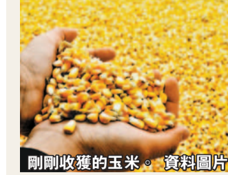
剛剛收穫的玉米。

據外媒報道，新疆生產建設兵團與烏克蘭農業公司KSG Agro簽署協議，後者將向中國提供10萬公頃農田，最終購買數量將增加至300萬公頃。這一投資將使烏克蘭成為中國在海外最大的農業中心。新疆建設兵團的一份聲明稱，根據這份為期50年的協