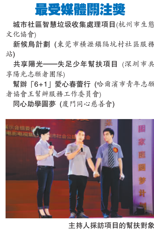
主持人採訪項目的幫扶對象