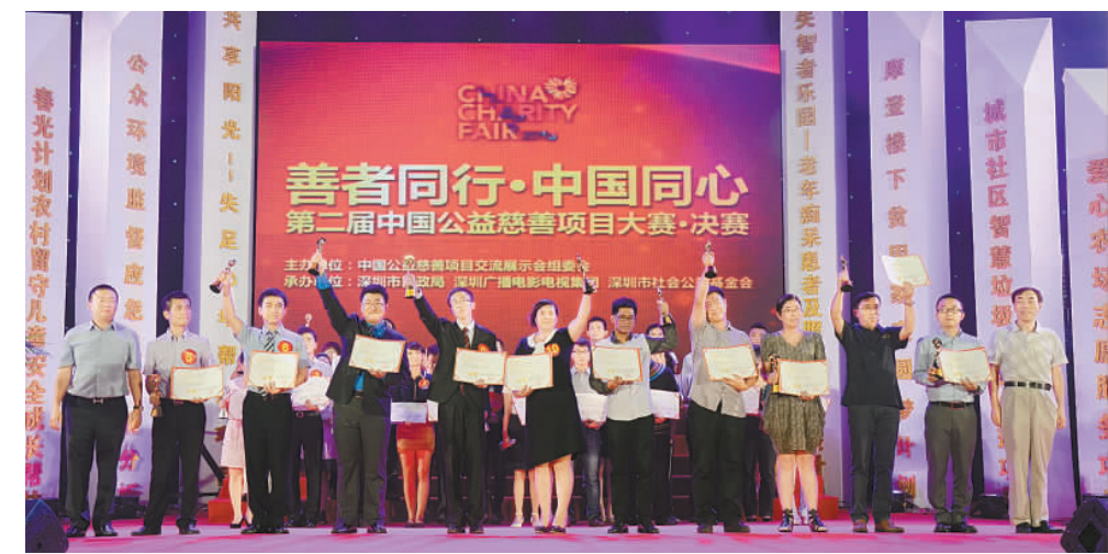
大賽金獎項目上台領獎