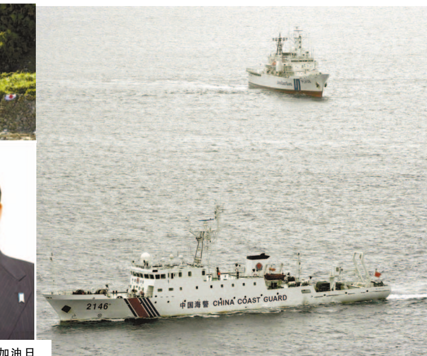
在釣魚島海域的中國海警船（前）和日本海上保安廳船隻（後）。

共同社報道，日本第 11 管區海上保安總部（那霸）18 日稱，在尖閣諸島（中國稱釣魚島）附近航行的 4 艘中國