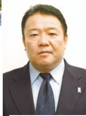
日本右翼團體「加油日本！全國行動委員會」總幹事水島總