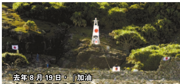
去年 8 月 19 日，「加油日本！全國行動委員會」成員登上釣魚島並展示日本國旗。