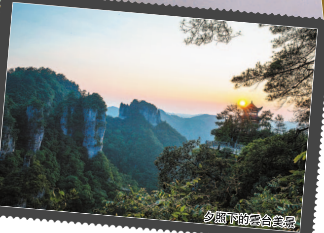
夕照下的雲台美景