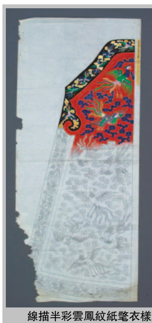
線描半彩雲風龍紋紙筆衣樣