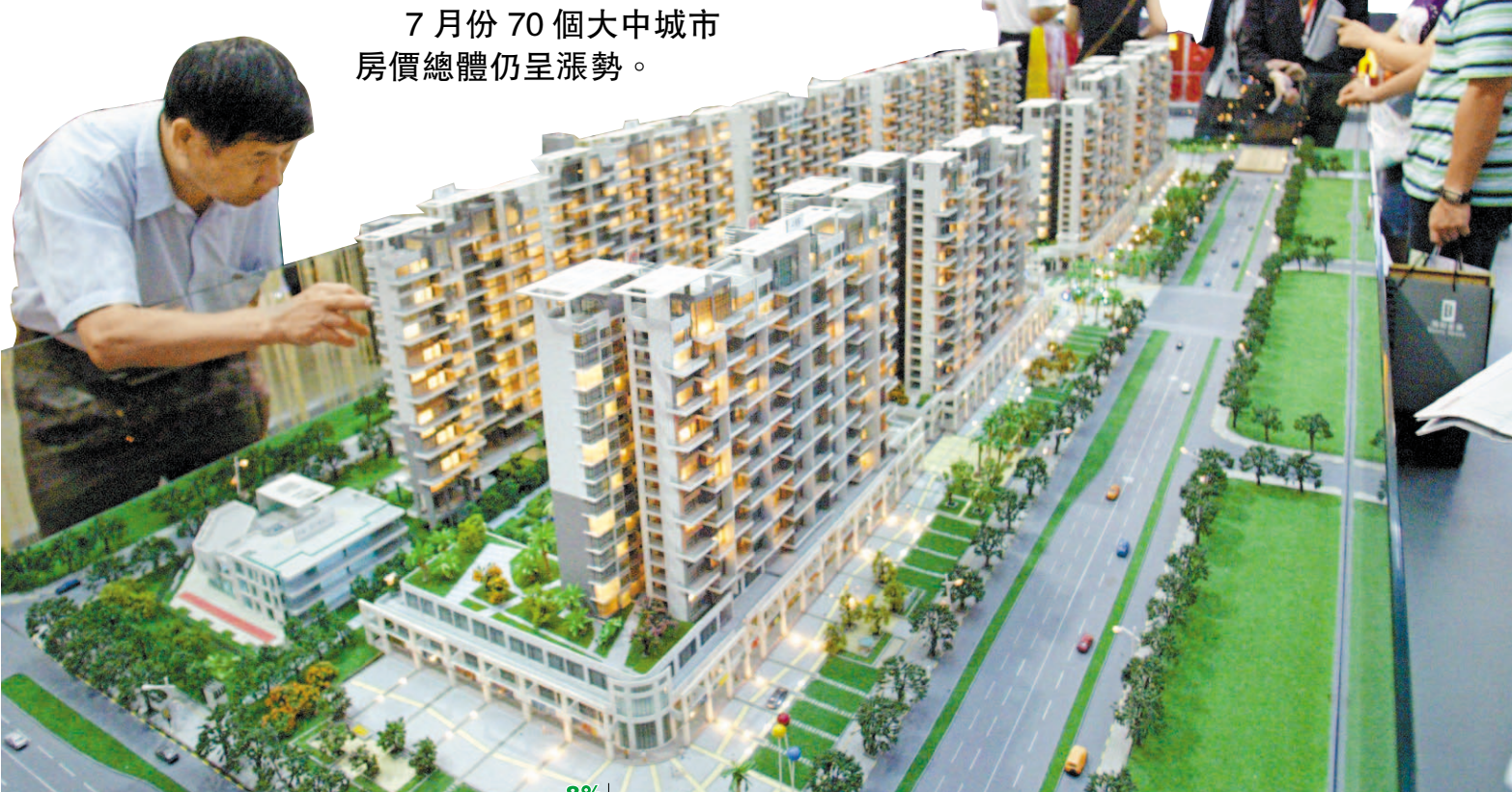
7月份70個大中城市房價總體仍呈漲勢。

【香港商報綜合報道】在連續7個月的「高燒」後，中國70個大中城市的房價在7月份繼續「全線」上漲。國家統計局昨日公布7月份70個大中城市住宅銷售價格變動情況，數據顯示，與去年同月相比，70個大中城市中，價格下降的城市有1個，上漲的城市有69個。7月份，同比價格上漲的城市中，最高漲幅為北京的18.3%，漲幅比6月份回落的城市有7個。官方分析，7月份房價上漲城市個數與6月份基本相同，主要受剛性需求拉動和近期地價上漲等諸多因素影響。