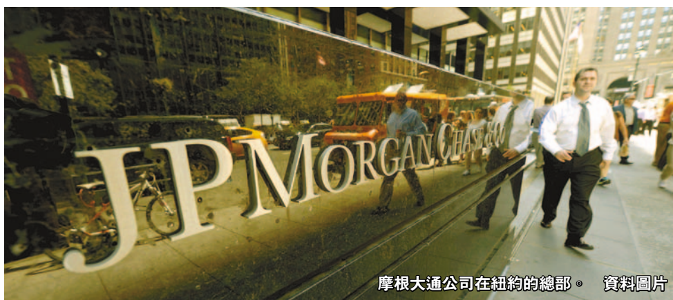
摩根大通公司在紐約的總部。資料圖片

【香港商報訊】據《紐約時報》報道，美國政府已經開始調查摩根大通(JPMorgan)是否在中國僱傭官員的子女，以幫助其贏得中國業務。涉事人員包括光大集團董事長唐雙寧之子以及前鐵道部副總工程師張曙光之女。 或助小摩獲中國業務 上周末，《紐約時報》網絡版引用一份美國政府機密文件作為其文章的來源。該報稱，摩根大通會僱傭前中國銀監會副主席、光大集團董事長唐雙寧之子，隨後摩根大通獲得一些來自中國企業集團的重要業務，其中包括2011年摩根大通成為光大銀行上市計劃的12家財務顧問之一，以及2012年獲得光大國際出售資產的業務。 而張曙光之女被摩根大通香港支行僱傭後，摩根大通被選為中鐵集團整體上市的保薦人之一。目前涉事兩人均已離開摩根大通。