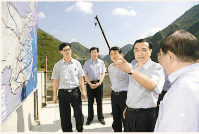
李克強考察蘭渝鐵路木寨嶺隧道施工現場。

【香港商報訊】據新華社報道，18日李克強考察蘭渝鐵路木寨嶺隧道施工現場。負責人說：未來三年西部將開工一些大項目，總長1.2萬公里，佔全國新開工鐵路的53%。 李克強說，西部鐵路開發意義重大，這不僅是人民翹首以盼，更有利於中西部接收東部產業轉移。鐵路建設對扶貧、產業發展意義大，西部發展是中國最大的迴旋餘地所在，西部發展起來，拉動了就業，國家的就業就更有希望。 李克強對工人們說：「在西部山區修鐵路非常艱苦，但你們是用艱辛和努力為西部貧困人口打開致富大門。一定要既保證工程質量，又保證自身安全。」