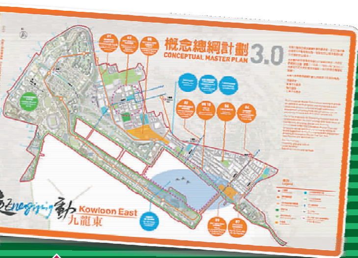
「概念總綱計劃3.0」詳細解釋整個啓德發展區的規劃概念和目標。 政府藉發展啓德對整個九龍東的規劃和交通作出提升。右二為財政司司長曾俊華。

曾俊華於網誌中表示，市場對寫字樓需求與日俱增，惟中環及灣仔等商業核心區供應已接近飽和，須另覓商貿中心區發展。而早於90年代初已有發展商看好觀塘及九龍灣一帶潛力，將區內不少工廈重建為商業樓宇，至現時觀塘區已有140萬平方米及3座酒店之寫字樓樓面面積供應，計算啓德發展區在內預計未來寫字樓樓面總量可達540萬平方米，相等於兩個中環所提供之寫字樓供應量，其中啓德區內預留的106萬平方米商廈區大約可建成5座國際金融中心或4座環球貿易廣場之規模，足以帶領東九龍發展成另一個商業核心區(CBD)。