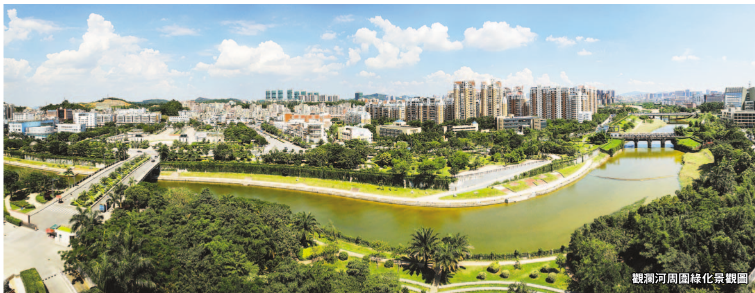
觀瀾河周圍綠化景觀圖

區一城」建設的必然要求。新區積極探索新思路、新方法、新舉措，推進城市管理「四個轉變」，所謂「四個轉變」，即由粗放向精細、由縣城向大都市、由邊緣城區向中心城區、由國內一般城區向國際化先進城區轉變。除推動「四個轉變」之外，新區還將貫徹「大城管」、「細節決定成敗」及「三分建、七分管」的理念，推動城市精細化管理，同時重點提高市容環境水平，打造綠化亮點，攻克市容秩序的難點。去年新區印發了《龍華新區開展「5633」嚴管示範區工程實施方案》（深龍華管辦[2012]53號），明確至2015年止，每個辦事處每年劃定5條重點道路、6個重點區域、3個示範性公園、3個重點工業區作為市容環境嚴管區，從環衛、愛衛、餘泥渣土、燈光、園林、地面鋪裝、立面整治、市容執法、秩序優化、景觀營造、重點工業