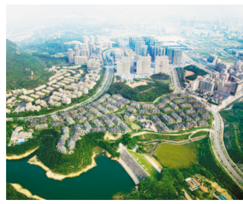
民治牛咀水庫航拍圖

隨著特區一體化重大決策的實施，深圳北站在深圳城市和經濟發展戰略中的地位更加凸顯，打造深圳經濟「升級版」的任務更為緊迫。二線拓展區可謂是深圳經濟、深圳品質、深圳二次創業的落腳點。