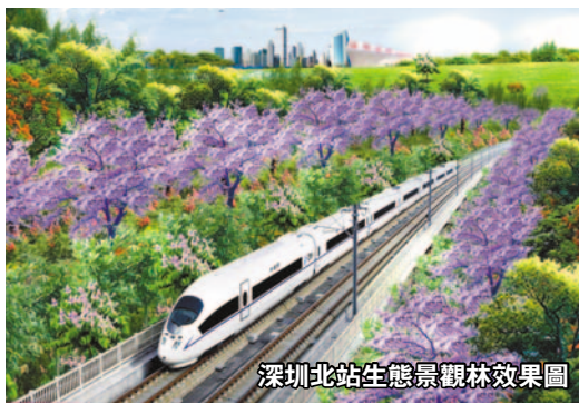
深圳北站生態景觀林效果圖

區、示範性公園等方面著手，高標準、高要求做好市容環境綜合整治，打造新區市容環境風景線。新區城管部門進一步提出了8項改革創新計劃，以2013年為起點至2015年，以「智慧城管」為平台，促進城市管理精細化創新督察方式，提高工作效能；試行「路長制」，改善市容秩序；引進社會監管力量，提升外包服務成效；加快園林綠化建設，打造綠色新區；加強環衛工作，提高新區環衛水平；堅持學習教育，提升隊伍素質；加強社會互動，樹立良好的新區城管形象。