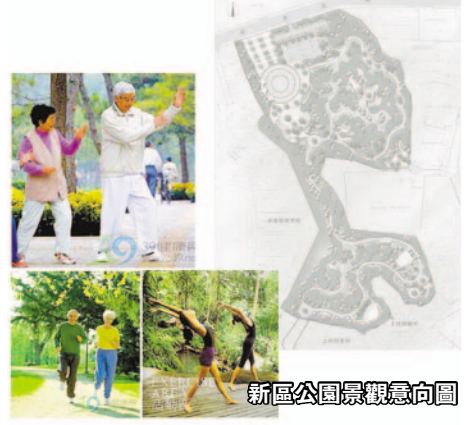
新區公園景觀意向圖

「半年見成效，一年一變樣」，2012年的一系列務實與創新之舉使得新區城市管理工作初開新局。然而，城市管理精細化並非朝夕之功可成，「點多、面廣、線長」的現實難題依然需要持續的創新思路予以突破。今年，新區黨工委書記姜建軍給新區城管部門提出了「打造城市優美環境，你要怎麼做？」的命題。圍繞這個命題，新區城管部門積極組織全體幹部職工展開討論，集思廣益，探索問計於民，發動廣大群眾獻計獻策。據悉，在加強社會互動方面，新區城管考慮將「問計於民」活動常態化，對外建立城市管理社會參與機制，探索城市管理的市民聽證制度，廣泛吸納社會各方面意見，持續開展城管工作「問計於民」活動，定期邀請社區居民、個體經營者等群體對城市管理工作進行評分，根據評分結果督促整改，實現城市管理的社會化。另外，城管部門還將進一步健全和完善群眾參與城管工作、共享城管成果的有效機制，廣泛調動人民群眾以主人翁姿態積極投身城市管理工作，不斷增強居民的城市意識和家園意識。