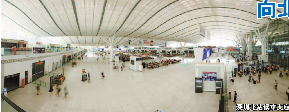
深圳北站候車大廳

深圳在地理位置上毗鄰香港，一衣帶水。在改革開放30年來，深圳一直秉持「服務香港、發展自己」的理念，三個口岸的興建和繁榮，也清晰地表達了深圳城市發展的脈絡：第一個十年，以羅湖口岸的興起為標誌，羅湖成為深圳發展的中心；第二個十年，以皇崗口岸的興起與CBD的落定和市民中心的建設為標誌，福田成為發展的中心；第三個十年，城市中心開始事實上向西突進，以深圳灣口岸開通為標誌，包括後海、前海、寶安中心區等正在迅速崛起。