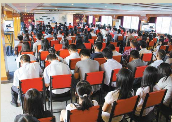
六祖文化講堂上的聽眾

佛陀在千年前就吶喊一切眾生皆有佛性，禪宗的禪幫助眾生直接認識內心的佛性。濟群法師說，佛是覺的意思，禪修就是開發人們生命內在覺悟的本性。「佛陀的人格是代表覺醒，覺悟的人是佛陀的意思，成佛就是最高的覺悟。」濟群法師說，禪的本質就是佛的本質，佛是覺的意思，禪修就是開發人們生命內在覺悟的本性。反過來說，如果沒有覺醒，生命將活在貪、嗔、癡的迷塔裏，永遠走不出來，又談何幸福呢？