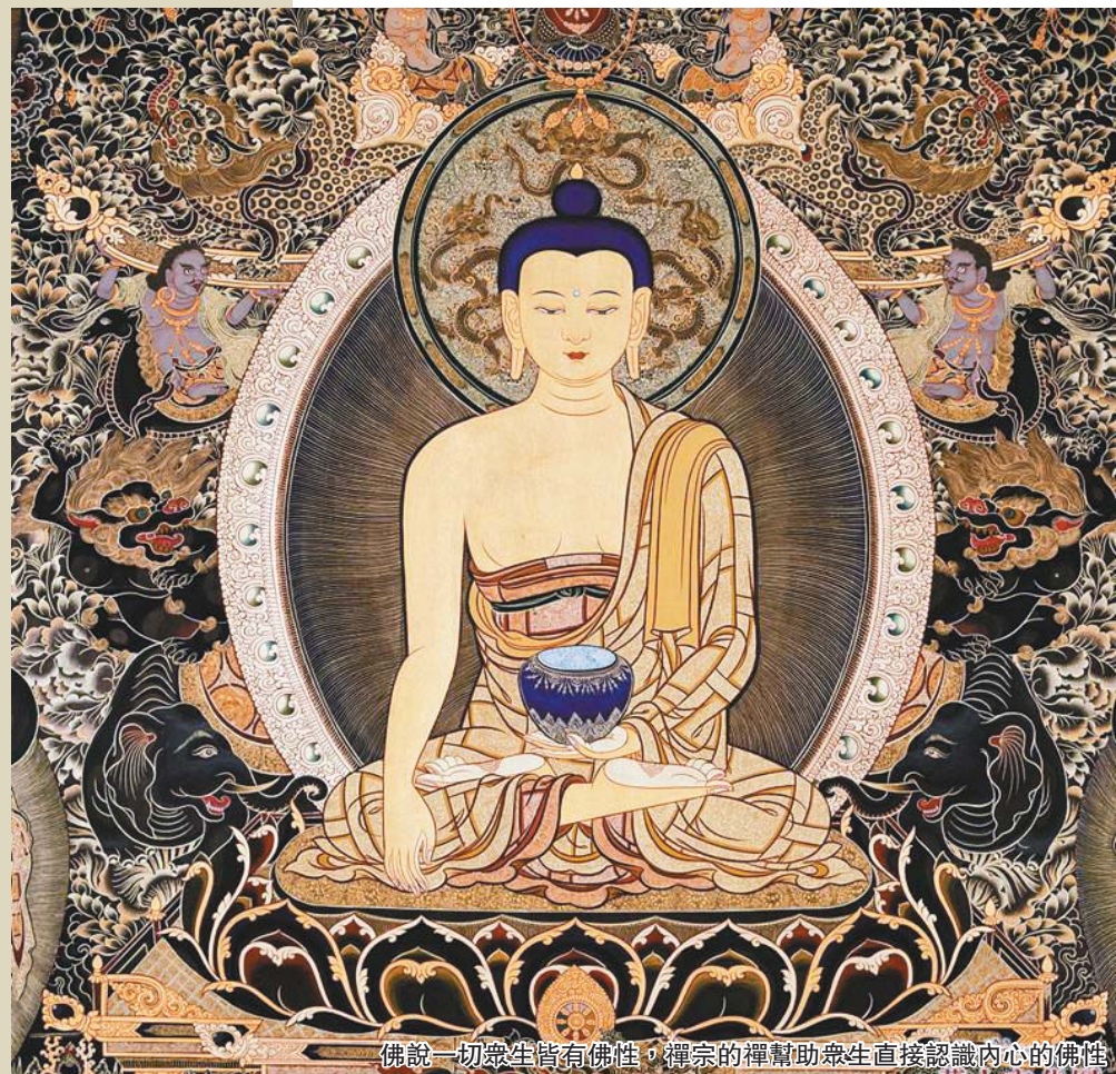
佛說一切眾生皆有佛性，禪宗的禪幫助眾生直接認識內心的佛性