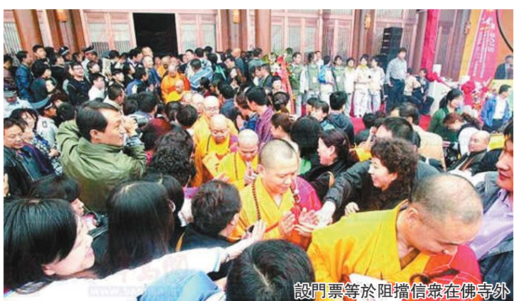
設門票等於阻擋信眾在佛寺外

但是，在這場叫停「門票」的信仰保衛戰中，佛教界人多勢弱。歷史原因造成的宗教界利益鏈條使佛教界喪失了重要話語權，加之佛教相關職能部門因各種原因集體失語，最終形成宗教界區區高唱猛進，佛教信眾訴求無門的怪現象。教界呼籲佛教要走出圍牆困境，首先應自身保持清淨，不被商業大潮裹挾。佛寺免門票，依然讓人期待。