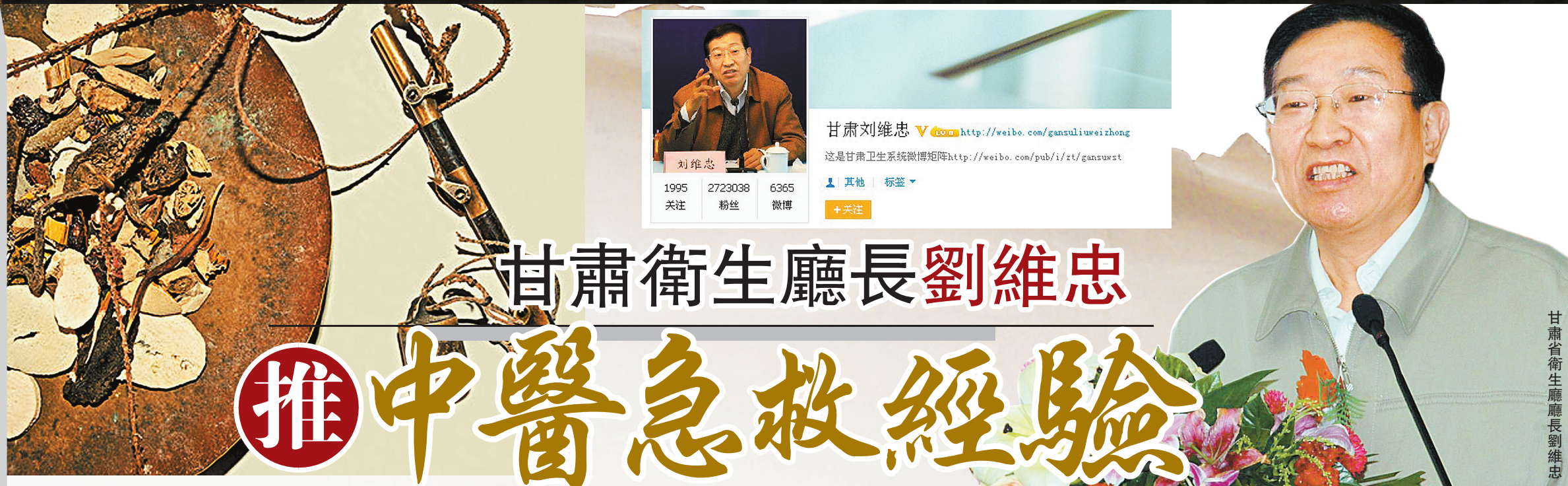
甘肅省衛生廳廳長劉維忠