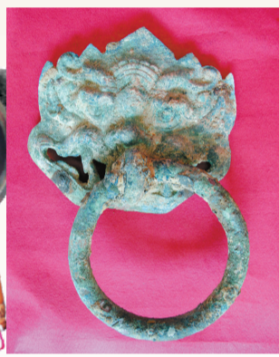
鎏金銅銜銜環鋪首。

一位曾參與現場考古的工作人員向本報透露，發掘之初，工作人員並未意識到這是一座帝陵。因為，僅從墓室規模判斷，墓主人連當時的富人都算不上，已發掘的西側墓室有墓室、耳室和甬道，南北長4.98米，東西長5.88米，墓室深2米多，只能算中小規模。但發掘過程中出土的一塊墓誌