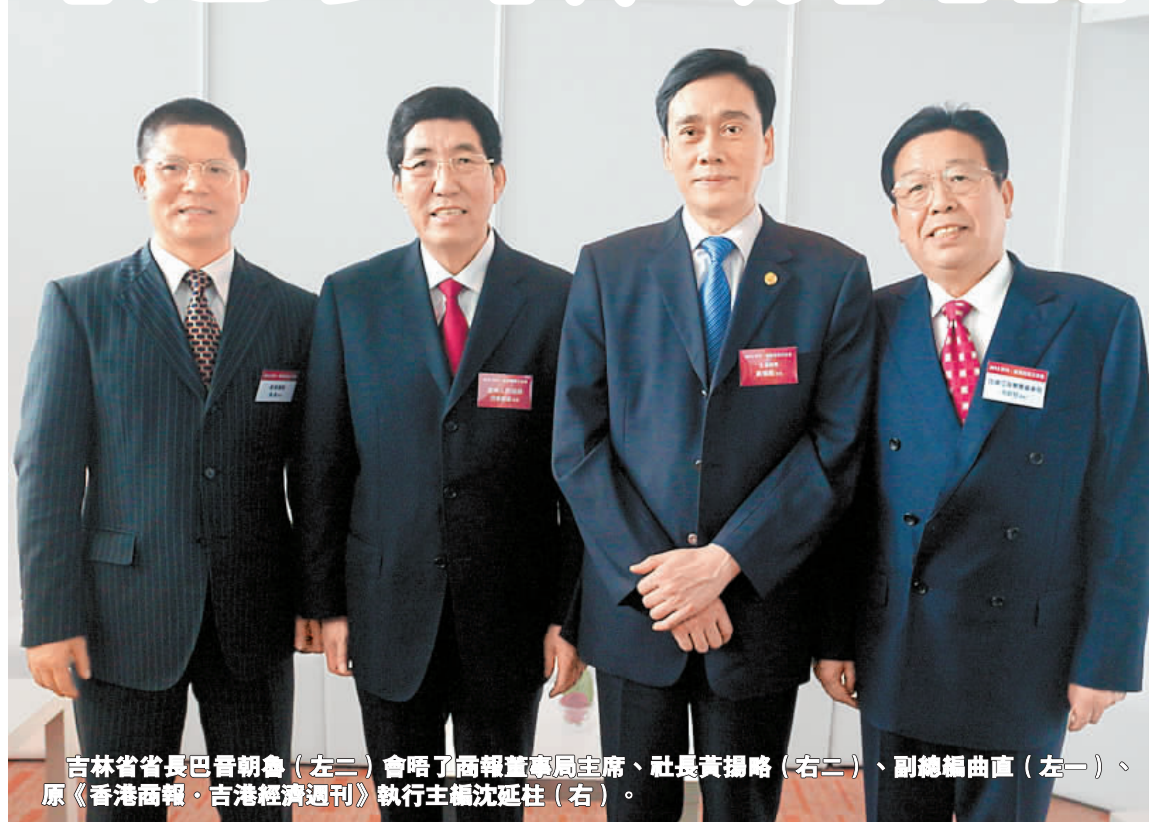
吉林省省長巴音朝魯（左二）會晤了商報董事局主席、社長黃揚略（右二）、副總編曲直（左一）、原《香港商報》、《香港經濟週刊》執行主編沈延柱（右）。

上述會晤中，原《香港商報》、《香港經濟週刊》執行主編沈延柱、商報駐吉林辦事處主任冀文嫻在座。