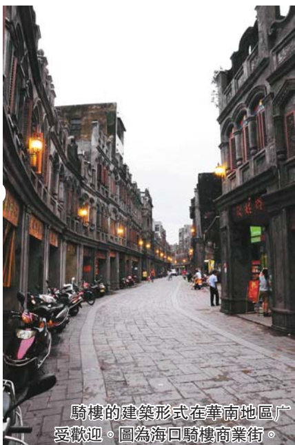
騎樓的建築形式在華南地區廣受歡迎。圖為海口騎樓商業街。