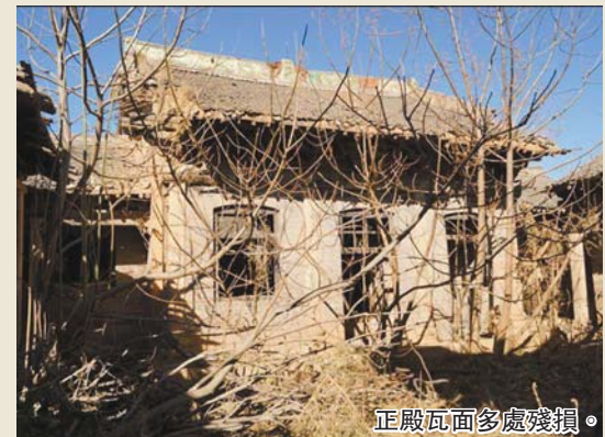
正殿瓦面多處殘損。

山西沁水上木亭城隍廟，很大的一組建築，正殿、獻亭等爲明代建築，戲樓等清代增修，現在廟裏的房子幾乎個個殘破，正殿瓦面脫落滲水嚴重，獻亭塌了大洞已經腐朽了多年；西廂今年垮塌了，壁畫正在被雨水侵蝕，如果沒有搶救措施，這座大廟用不了幾年就會塌毀殆盡。