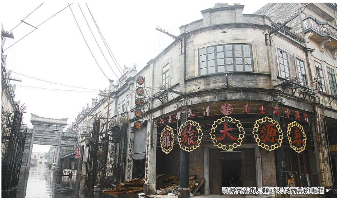
騎樓商業街見證了現代商業的崛起。