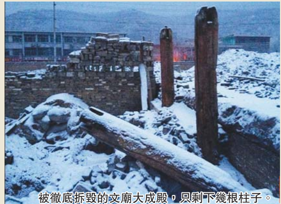
被徹底拆毀的成廟大成殿，只剩下幾根柱子。

山西中陽文廟大成殿，中陽文廟過去規模很大，早年被糧庫佔用，現僅存一座大成殿，明代建築，五間六椽，建築面積220平方米，非常有氣派的一座大殿，在文物匱乏的中陽縣非常難得，現在文廟所處位置已是縣城內的黃金地段，今年10月，文廟大成殿被徹底拆除，原址將用來建設一個商業地產項目「儒城國際」，縣裏計劃把大成殿遷到郊外重建。文物爲地產讓路，沒想到在偏僻的縣城也會發生！