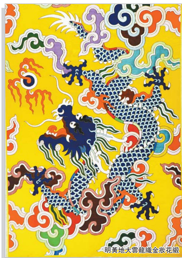
明黃地大雲龍織金妝花緞

作為雲錦國師，金文先生表示，南京雲錦申遺成功之後，應該多開發新品種，走進尋常百姓的生活中。如此，一直作為皇家王親貴族的雲錦才能有更多的更好的復興空間。