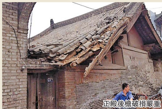
正殿後檐破損嚴重

山西新絳三官廟，第六批國保古建，現存元代正殿和獻亭，獻亭現在是一家水暖店，正殿關閉多年，後檐屋頂破損椽風折斷，殿內漏水致使西山處兩尊元代彩塑完全粉化。已經成為最高級別的文保單位，多年來連最基本的維護都沒有，房子破了可以修，國寶級的彩塑如何補救？這座廟就在縣城內，近在咫尺卻視而不見！文物遭到如此破壞不僅僅是缺錢的問題，很多時候是缺一顆人心！