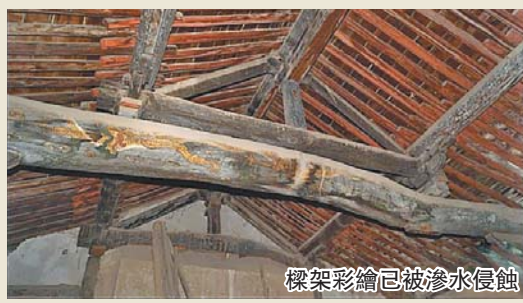
樑架彩繪已被滲水侵蝕

山西新絳光村玉帝廟，正殿元代，完全塌了一間，殘存兩間，這兩間也有不少滲漏了，彩繪被不斷侵蝕，元代建築在運城地區並不多見，早發現的不少已成國保，希望玉帝廟也能得到很好保護。