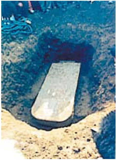
微山縣馬坡鄉出土的梁祝墓記碑