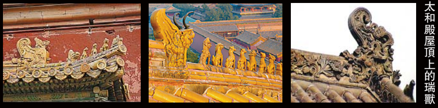
太和殿屋脊上的瑞獸