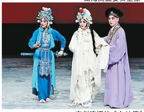
京劇演繹的《白蛇傳》