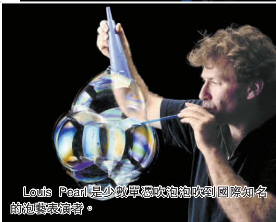
Louis Pearl 是少數專職吹肥皂泡吹到國際知名的泡藝表演者。