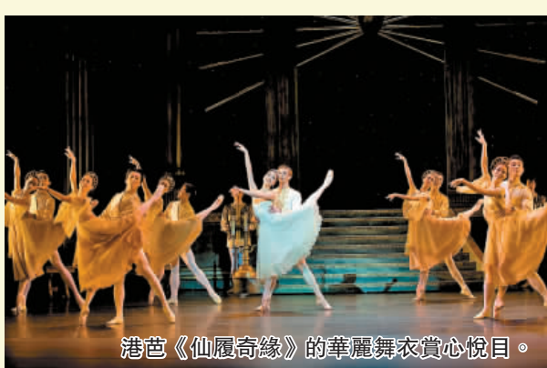
港芭《仙履奇緣》的華麗舞衣賞心悅目。

日期：8月31日至9月2日 時間：晚上7:30 日期：9月1及2日 時間：下午2:30 地點：香港文化中心大劇院 內容：香港芭蕾舞團(港芭)將以《仙履奇緣》為新季揭幕開幕！舞劇由著名編舞家大衛·艾倫編舞，配合浦羅菲夫不朽的動人旋律，和彼得·卡索列華麗的布景及服裝設計，組合成一套適合一家大小觀看的暑期壓軸表演節目。這個膾炙人口的故事包羅了灰姑娘與王子的浪漫邂逅、玻璃鞋的夢幻想像、黑心姐姐令人捧腹的滑稽行徑，還有衣香鬢影的皇家舞會等，定必會勾起不少家長觀眾的快樂童年回憶。觀眾還將看到仙女魔術棒一揮，南瓜即變成閃爍生輝的漂亮馬車，老鼠又會變成駿馬等神奇場面，當然還有舞者精湛的古典芭蕾舞技巧。灰姑娘的華麗化身固然令人賞心悅目，而她兩位姐姐的行為也一定會讓觀眾開懷大笑，實為消暑佳品。 文：熙