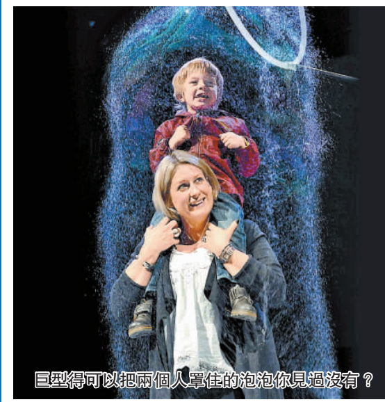
巨型得可以把兩個人罩住的泡泡你見過沒有？

日期：9月12及13日 時間：下午4:30 日期：9月14日 時間：下午4:30及晚上7:00 日期：9月15日 時間：下午2:30、下午4:30及晚上7:00 日期：9月16日 時間：上午11:00、下午2:30及下午4:30 地點：香港演藝學院戲劇院 票價：$395、$495、$550 (快達票)