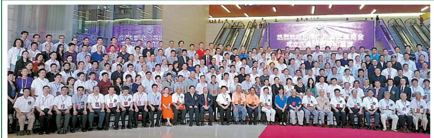
【香港商報訊】記者盛芳齡報道：廣東省安徽商會昨日在廣州舉行正式成立慶典大會。包括廣東省委常委、廣州市委書記萬慶良、廣東省副省長招玉芳、安徽省副省長花建慧等粵皖兩地官員在內的1000多名兩地商界界嘉賓出席了此次盛會。深圳報業集團社長、香港商報社長黃揚略也應邀出席了此次慶典。

據了解，徽商是有着悠久歷史的中國著名商幫，成長於唐宋盛於明。徽商承載着徽州深厚的文化，賈道儒行，以眾幫眾，義行天下，締造了稱雄明清時期商界四百年的奇蹟。近些年，徽商組織在全國各地紛紛成立並蓬勃發展，不僅傳承和發揚了徽商精神，而且加深了家鄉與所在地的經貿交往。