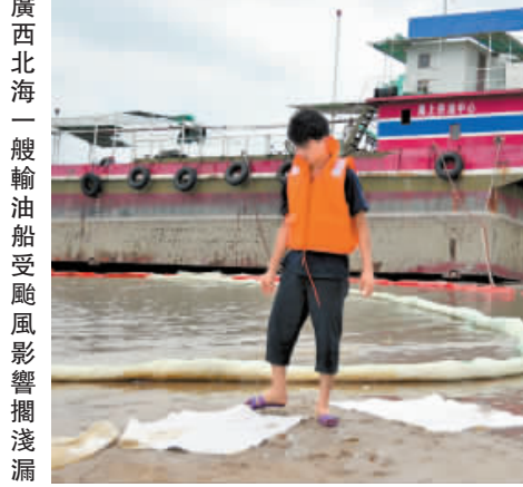
廣西北海一艘輸油船受颱風影響擱淺漏油，工作人員在現場清理油污。