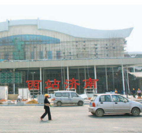
西站濟南就要歸位濟南西站。

還將建設綜合客運樞紐、綜合公交通樞紐、的士通道及專用停車場，這些配套交通距離主站房的步行路程基本都控制在10分鐘之內。