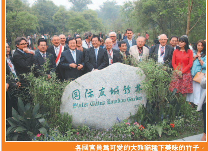
各國官員為可愛的大熊貓種下美味的竹子。

【香港商報訊】記者郭代勤報導：為期四天的成都國際友城周近日在成都開幕，活動期間舉行友城圖片展、新結友城簽字暨榮譽市民授予儀式、2011成都國際友城周開幕式暨友城市長圓桌會、友城旅遊合作論壇、國際友城使者頒發暨國際友城竹林揭牌儀式等12項主體活動。