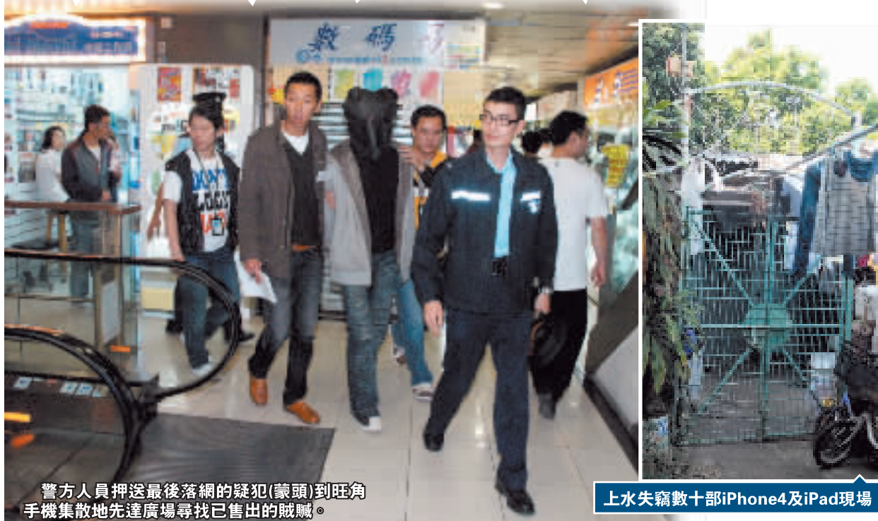
警方人員押送最後落網的疑犯(蒙頭)到旺角手機集散地先達廣場尋找已售出的賊贓。

附近街坊表示，案發現場鋅鐵村屋約100平方呎，由於經常有多名相信是租客的同鄉出入，估計是水貨客租用改作貨倉暫存貨物之用。街坊又稱，該村村民飼養多隻狗隻，假如有人入村必定會吠叫，但昨日凌晨案發時，狗隻沒有異樣，不排除匪徒是清楚該處環境及運作情況的熟人，並且知道存放貨物的種類。