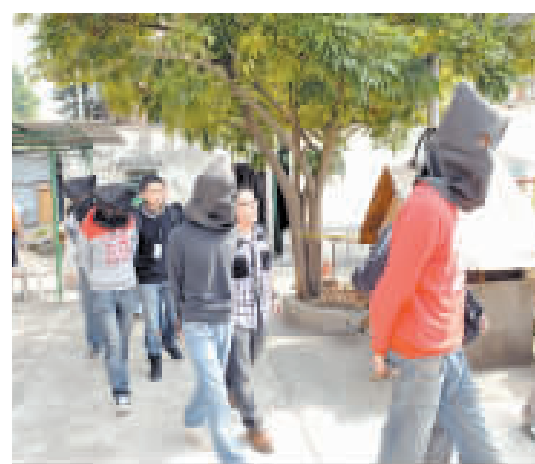
警方拘捕多名涉案男子返署扣查。

探員隨即打鐵趁熱，動用工具破門入屋搜查，再拘捕屋內其餘5名涉案男子，除了在紙箱內搜出5公斤「K仔」之外，探員另於屋內再起出0.75公斤「K仔」，合共價值64萬元。該批毒品分別被收藏於多個印有「鐵觀音」字樣的茶葉包裝袋內，相信毒販企圖魚目混珠，把毒品暗藏於茶葉包裝內，以逃避警方耳目。