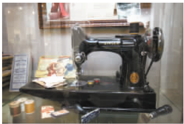
▲一部來自1959至1982年淺水灣酒店內裁縫店的古老衣車，該裁縫店由宋氏家族經營。