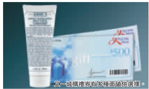
又一城購禮券有多種面值選擇。