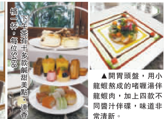
下午茶有十多款鹹甜美點，連香撻一碟，每位$168