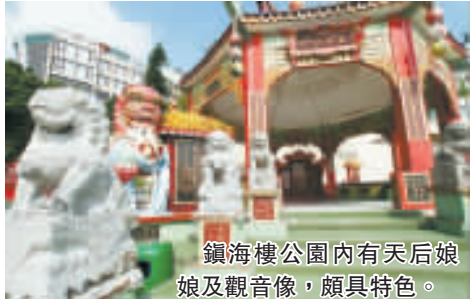
鎮海樓公園內有天后娘娘及觀音像，頗具特色。

淺水灣的東面有鎮海樓公園（面向海時，位於左手面）。公園建於上世紀70年代中期，具有濃厚中國古典色彩，並有兩座高十多米的天后像及觀音像，也有海龍王、海伯、麻姑及壽星公等塑像。園內特色景點還包括萬壽亭、長壽橋及象徵「金鯨獻壽」的鯨魚雕塑，不少遊人也喜歡在此拍照留念。