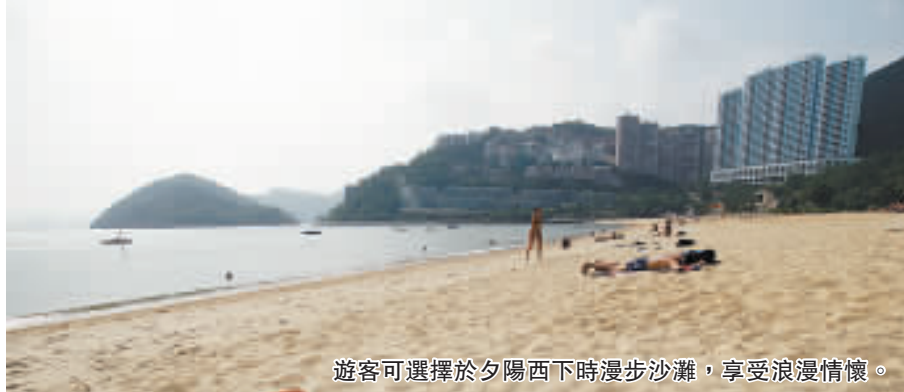
遊客可選擇於夕陽西下時漫步沙灘，享受浪漫情懷。

淺水灣呈彎月形，海灘綿長、波平浪靜，是香港最美麗的海灘之一。本地人和遊客也愛到此跟陽光玩遊戲，其愜意閒適的風情，令人迷醉。沙灘現已成為康樂及文化事務署轄下管理的泳灘之一，設有更衣室及淋浴設施，並有救生員值勤。