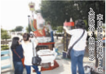
來自園內的遊客，也入鏡隨拍，拍照留念。