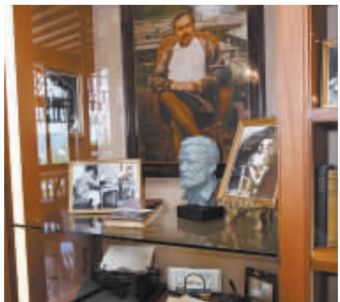
▲閱覽室內可見美國著名作家海明威於1941年訪港，下榻淺水灣酒店期間曾經使用的 Underwood Noiseless Portable 打字機。