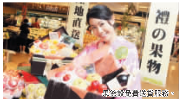
果籃設免費送貨服務。