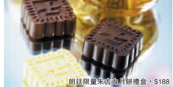
朗廷限量朱古力月餅禮盒，$188