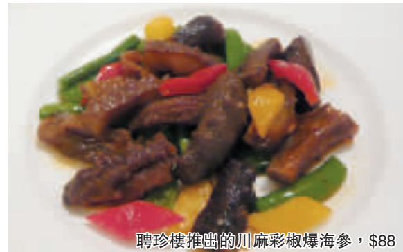
聘珍樓推出的川麻彩椒爆海參，$88